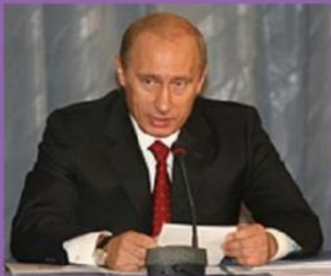
ВЛАДИМИР ВЛАДИМИРОВИЧ ПУТИН

«РЕЗУЛЬТАТОМ НАШЕЙ РАБОТЫ ДОЛЖНА СТАТЬ ОСОЗНАННАЯ МОЛОДЫМ ПОКОЛЕНИЕМ НЕОБХОДИМОСТЬ В ЗДОРОВОМ ОБРАЗЕ ЖИЗНИ, В ЗАНЯТИЯХ ФИЗИЧЕСКОЙ КУЛЬТУРОЙ И СПОРТОМ. КАЖДЫЙ МОЛОДОЙ ЧЕЛОВЕК ДОЛЖЕН ОСОЗНАТЬ, ЧТО ЗДОРОВЫЙ ОБРАЗ ЖИЗНИ – ЭТО УСПЕХ, ЕГО ЛИЧНЫЙ УСПЕХ»